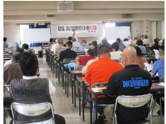
近畿での新たな政治勢力の結集めざして開催された2021年9月の集会